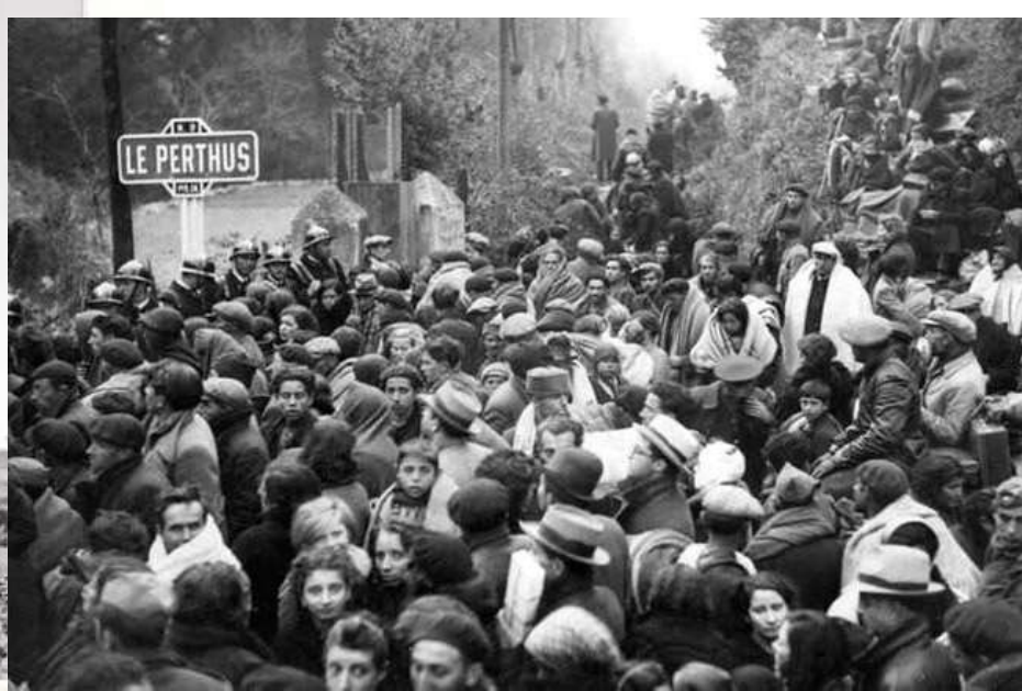
El cruce fronterizo