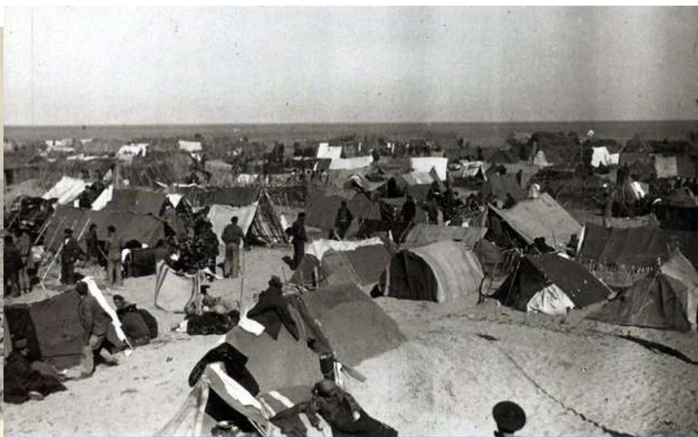
Campo de Argeles en febrero de 1939